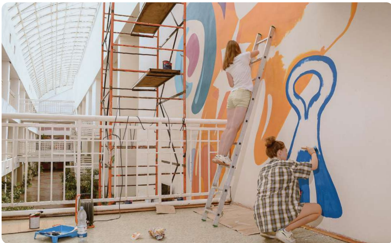
На фото: МБОУ СШ № 8 (г. Выкса) — работа над пространством

профессиональных архитекторов и художников они практиковались в создании макетов, думая, как сделать школу красивее и современнее. Как итог, они предложили собственную концепцию обновления школьного пространства, которая впоследствии была реализована.