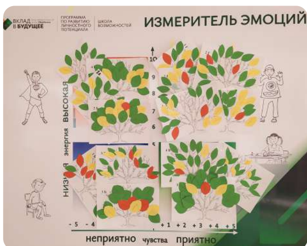
На фото: «Измеритель эмоций»

Во многих образовательных организациях появились «Открытая стена», «Измеритель эмоций», «Квадрат настроения».