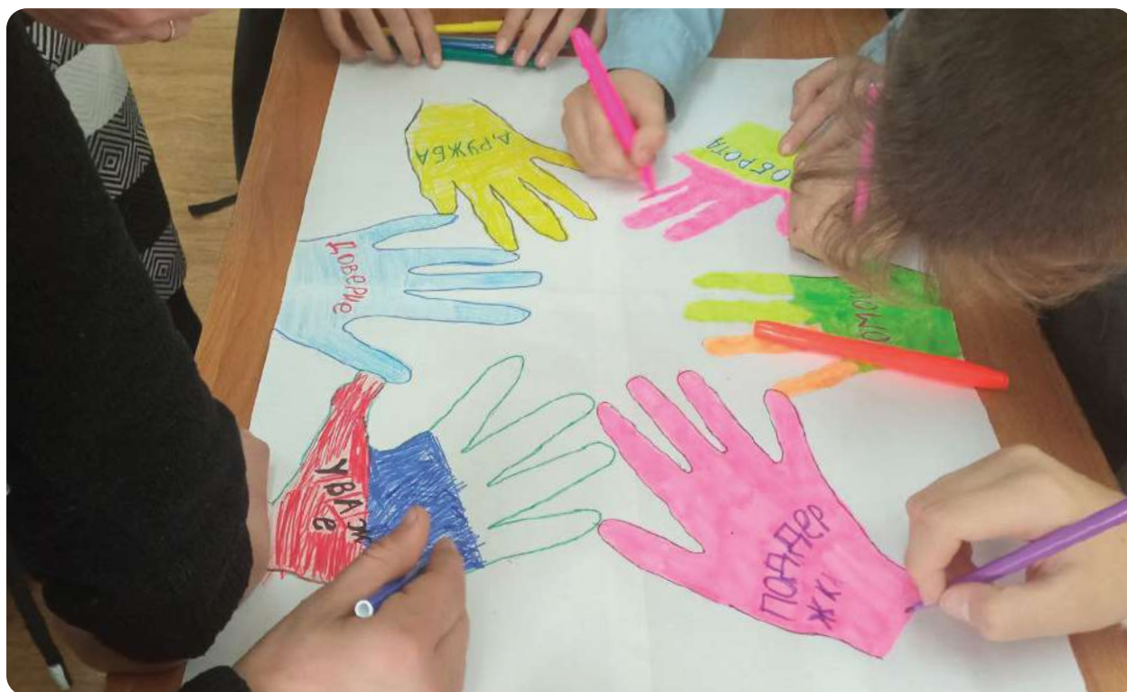
На фото: работа над «Соглашением»

школьники ставят цели, предлагают идеи и пути решения, составляют соглашения и планы дальнейших действий.