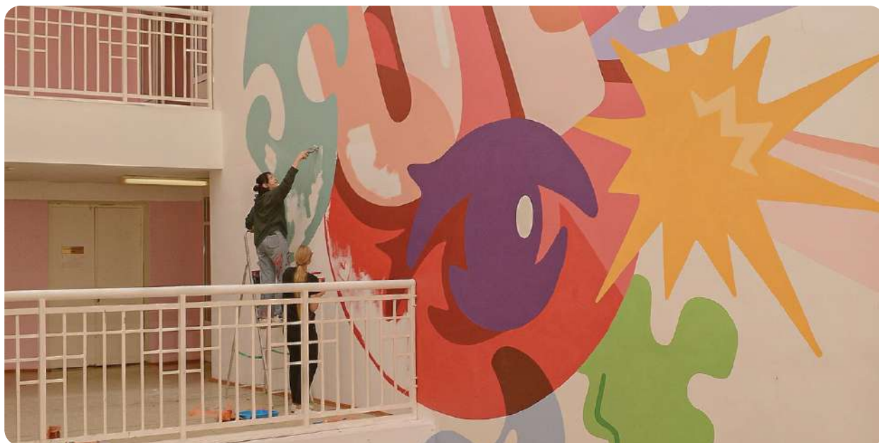
На фото: МБОУ СШ № 8 (г. Выкса) — работа над пространством

В средней школе № 5 г. Лысково появились «Зона презентаций проектов» и «Открытая библиотека».