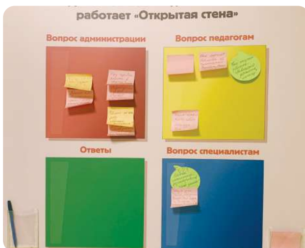
На фото: «Открытая стена»