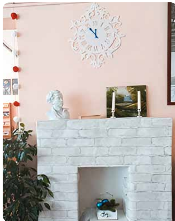
На фото: «Зона творческого самовыражения» для педагогов МБОУ «СОШ № 64», г. Барнаул