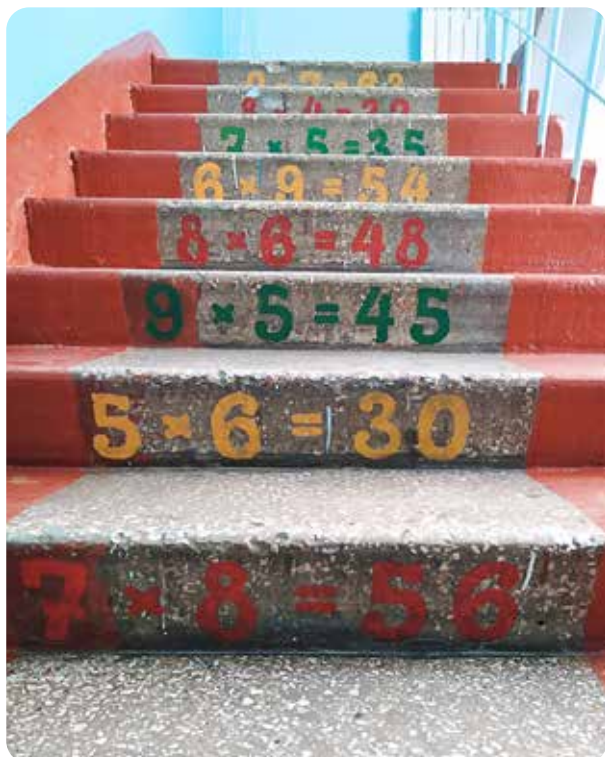
На фото: «Умные лестницы» в МБОУ «СОШ № 64», г. Барнаул