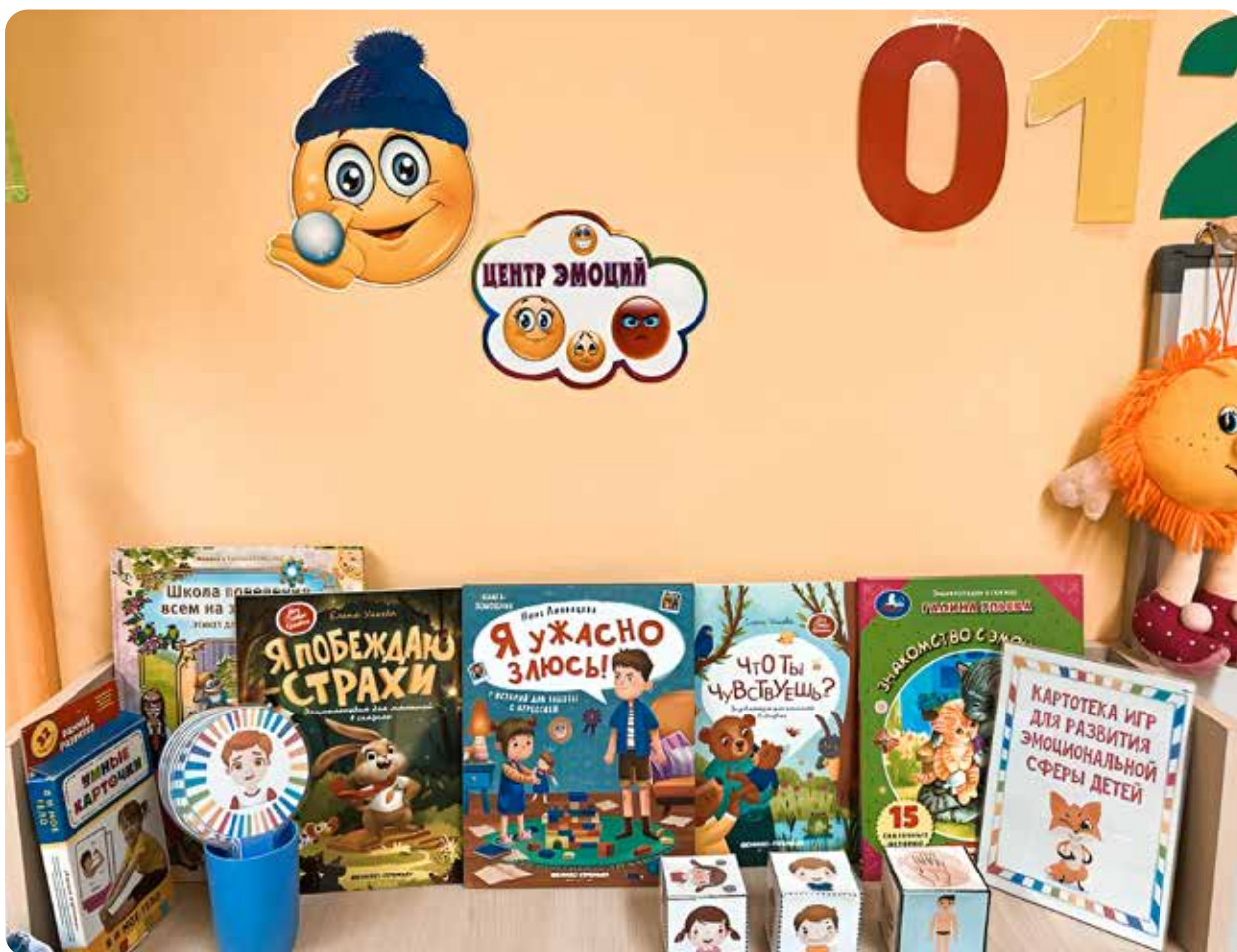
На фото: «Центр эмоций» МБДОУ ЦРР — «Детский сад № 239», г. Барнаул