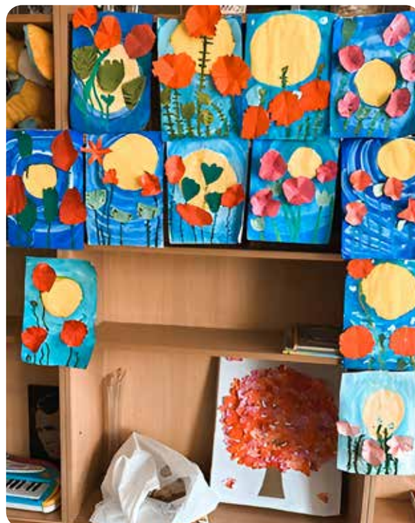
На фото: «Зона творческого самовыражения» в МБОУ «СОШ № 64», г. Барнаул